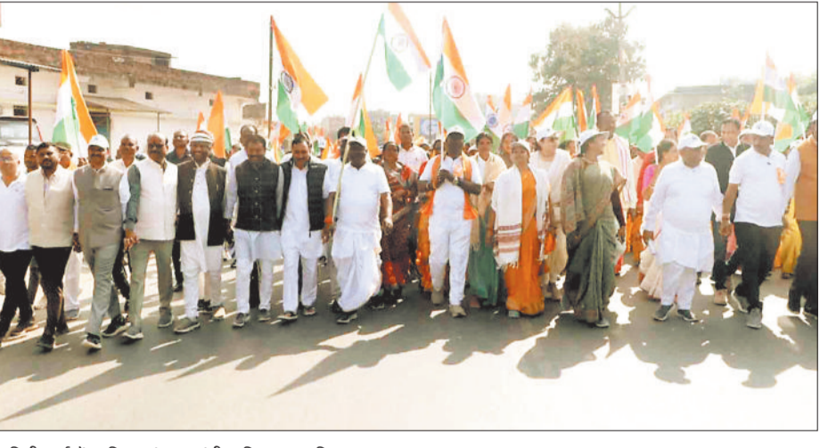
यूनिटी मार्च में शामिल सांसद, मंत्री व विधायक सहित अन्य।