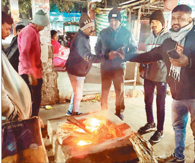
शहर में जले अलाव का सहारा लेते लोग।